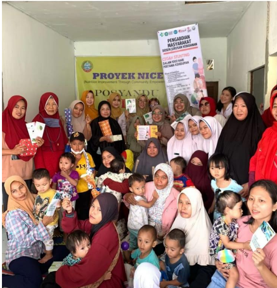
Gambar 2. Publikasi Media Masa

A'an Kamis, 7 September 2023 | 08:23 WIB