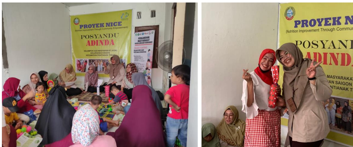
Gambar 2. Dokumentasi Kegiatan Penyuluhan