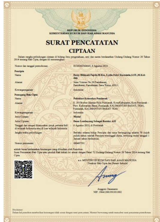
Gambar 3. Haki Modul Edukasi